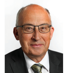
Chef du Nouveau Parti démocratique Gary Burrill

Le président vous souhaite la bienvenue à l'Assemblée législative et vous demande d'observer les règles de la tribune à la page suivante.