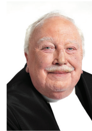
Président L'honorable Keith Bain

Le président de l'Assemblée législative est l'honorable Keith Bain, député de Victoria-The Lakes. Il est le 59 e président de l'Assemblée.