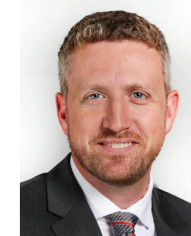
Chef de l'opposition L'honorable Iain Rankin