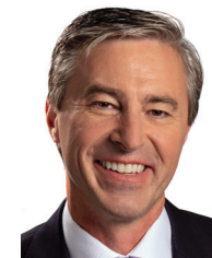
Premier ministre L'honorable Tim Houston

Élu par tous les députés, le président dirige les débats conformément aux règles et aux pratiques de l'Assemblée législative et, en cas de partage des voix, c'est lui qui a la voix prépondérante. Le président est également chargé d'administrer une vaste gamme de programmes liés à l'Assemblée législative et de fournir des services aux députés.